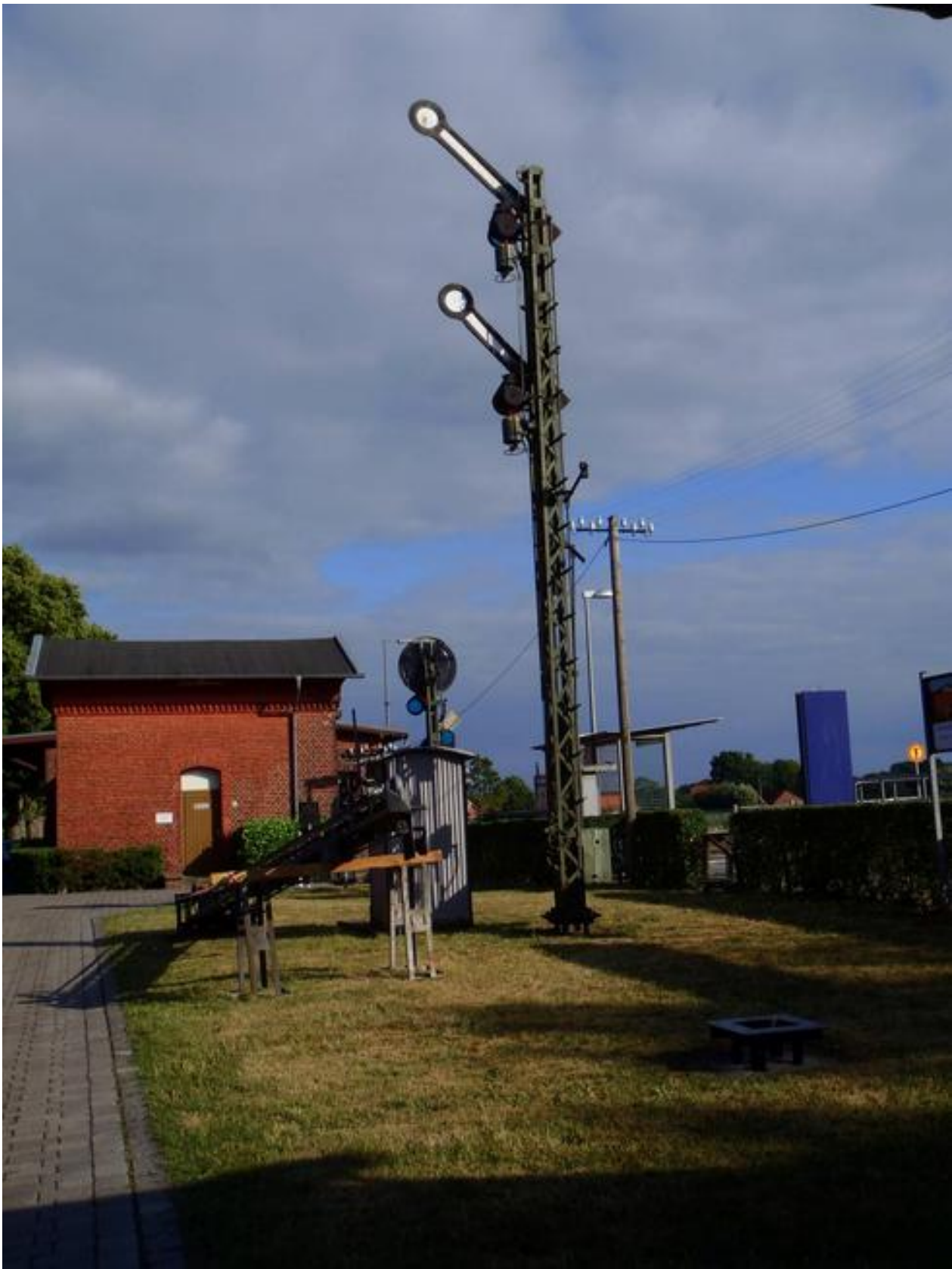
Das aufgebockte Flügelsignal im Museumsgarten