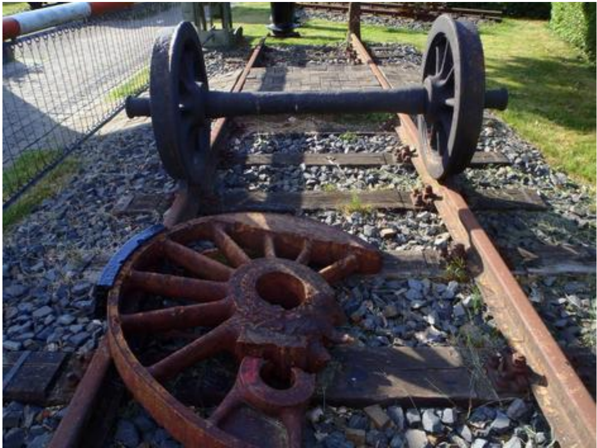
Radrest und Radsatz sollen endlich vom Bahnübergang an ihren vorgesehenen Ort