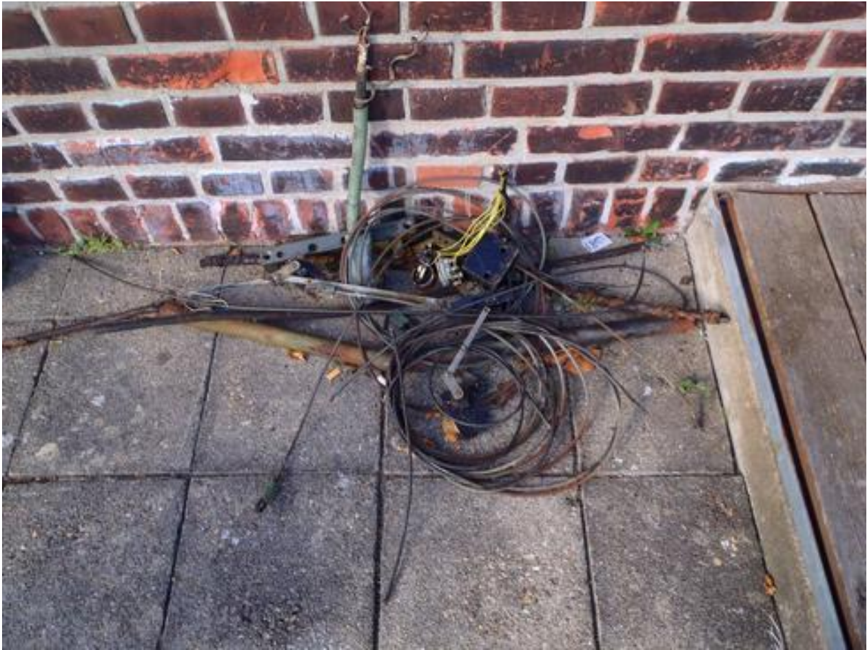
Reste vom Umbau

Der Kanal bis zum Signal muß noch gegraben werden