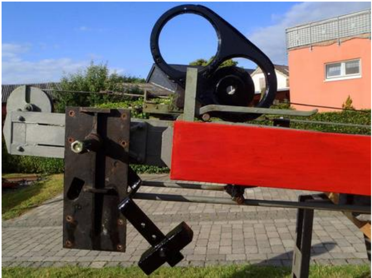
Hier fehlt der charakteristische Signalflügel