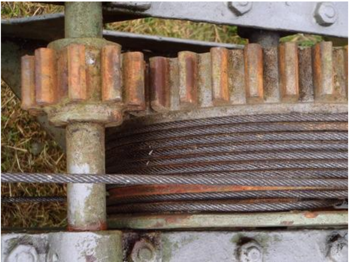
Hier fehlt nur noch das Schmierfett