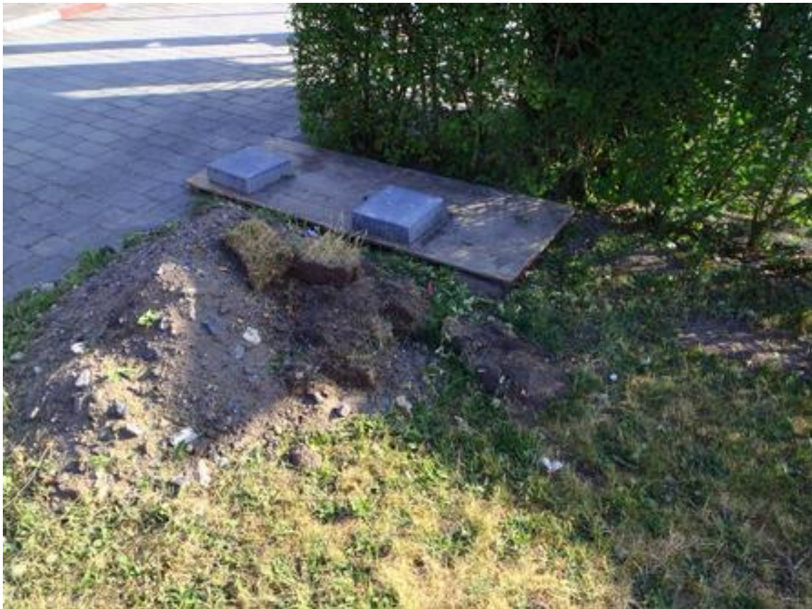
Der Geheimgang aus dem Bahnhof unter dem Pflaster hindurch endet vorläufig hier